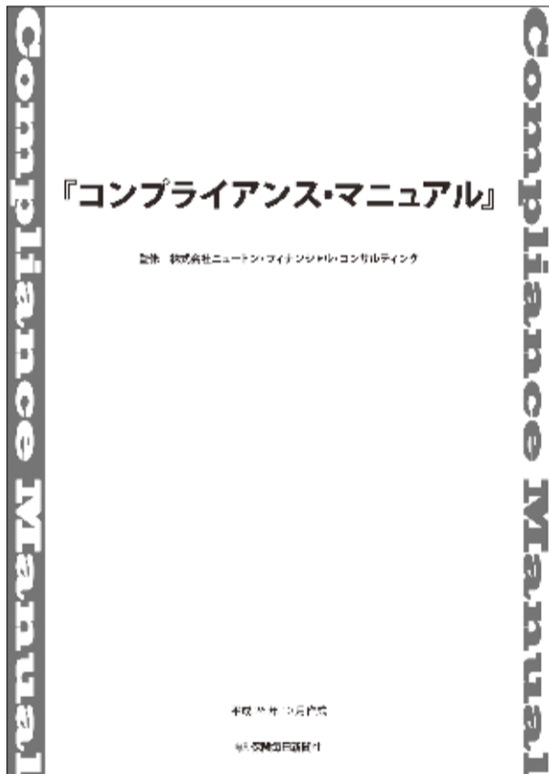
「電子版コンプライアンス・マニュアル」の表紙と紙面